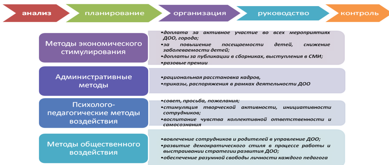
Рисунок 1. Алгоритм управления и методы управления в ДОО

Механизм управления ДОО изменяет характер выполнения управленческих функций, порождает принципиально новые формы взаимодействия ДОО и всех участников педагогического процесса. Проблема формирования организационной структуры управления требует, прежде всего, осмысления развития ДОО как комплексной социально-педагогической системы, учета объективных факторов ее демократизации. Решение задачи формирования организационной структуры управления мы видим в дальнейшем развитии демократических основ в управлении и как принцип государственно-общественного управления, и как систему его организации.